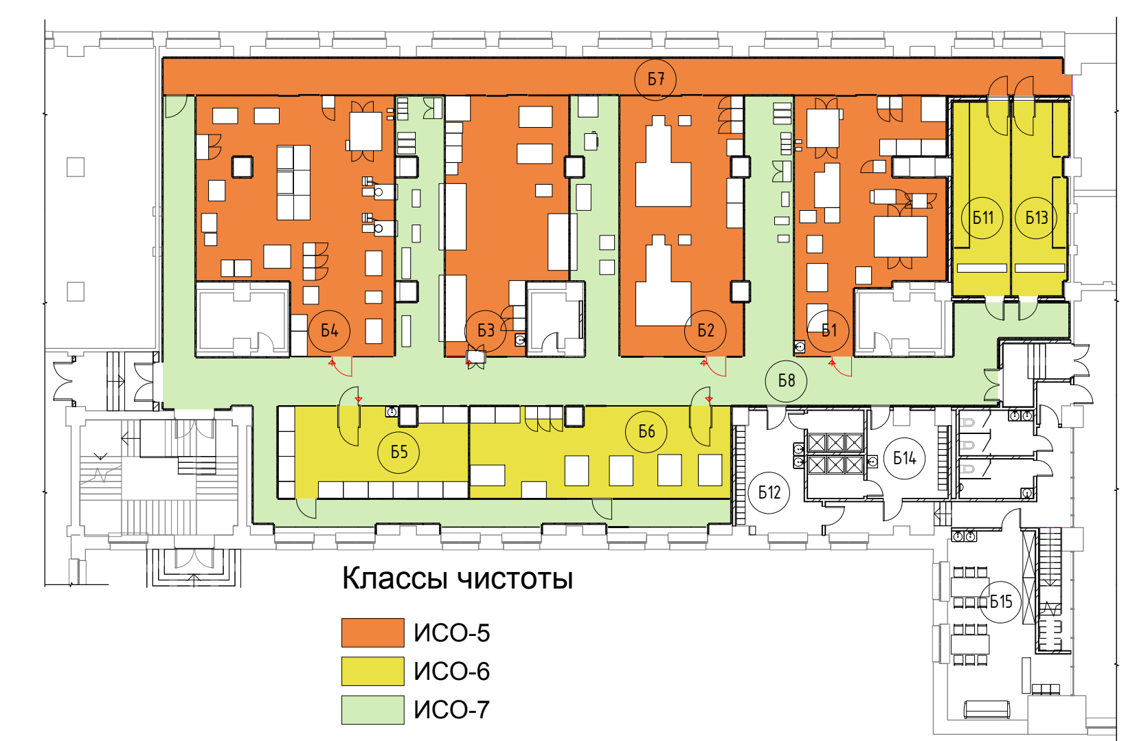
2 Зонирование по классу чистоты 1 : 250