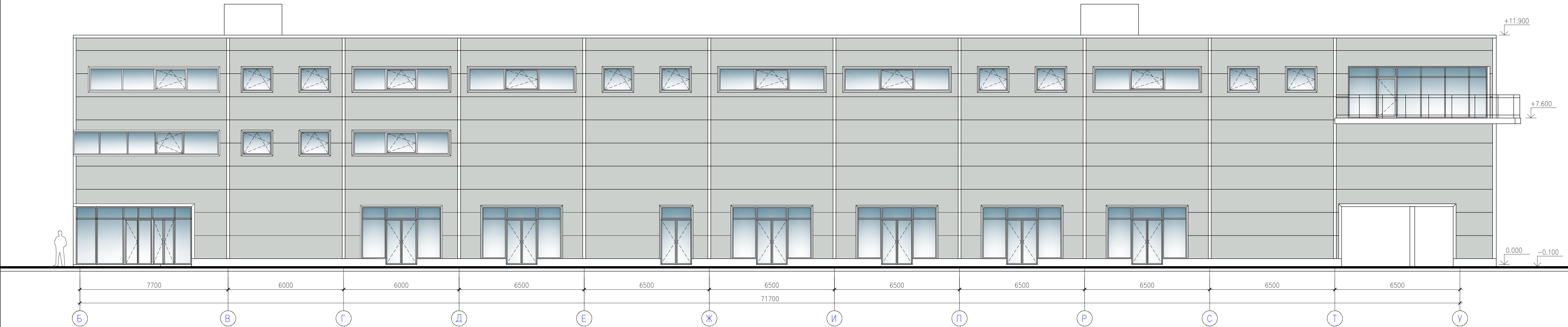
Фасад в осях Б–У