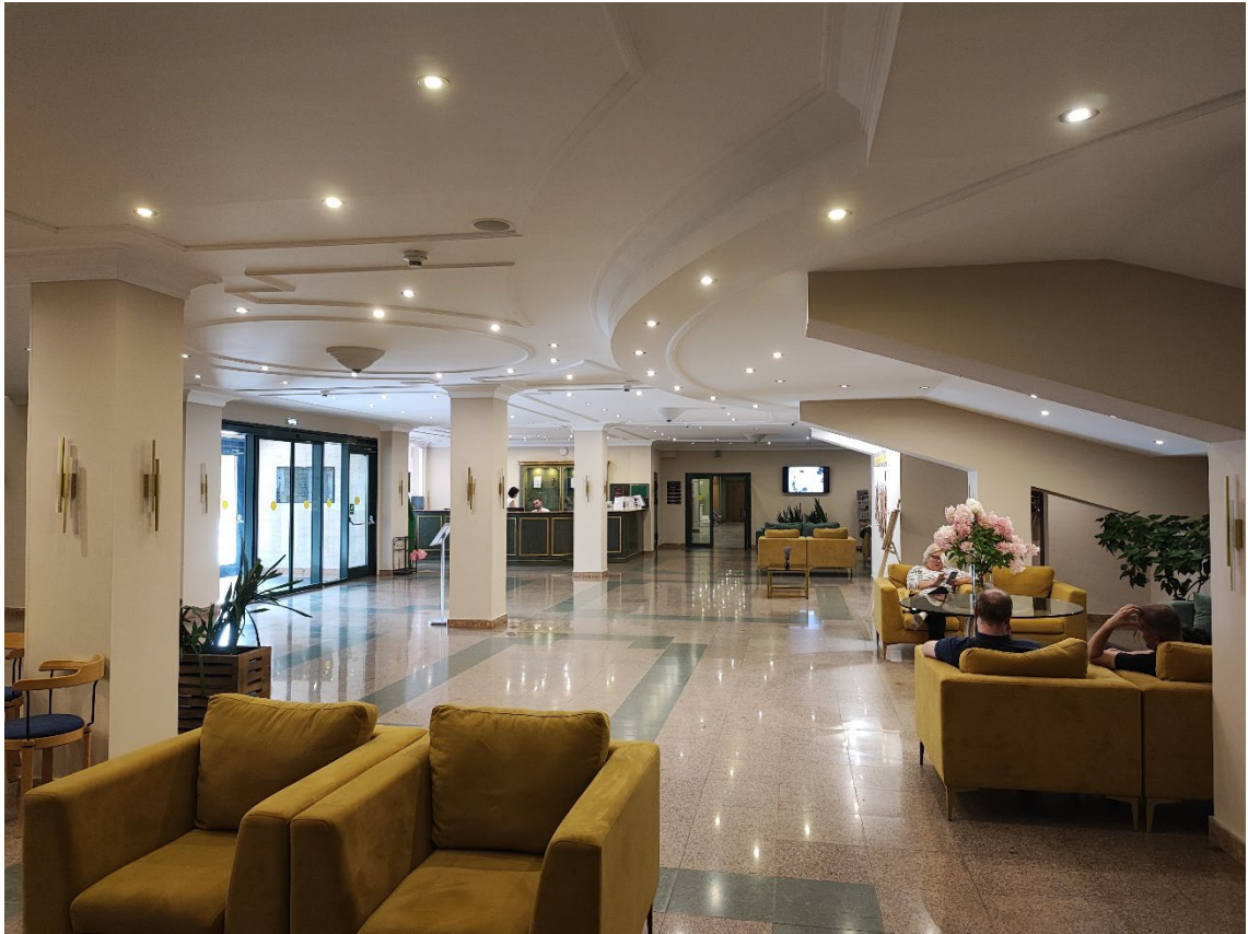
Общий вид 1 этажа