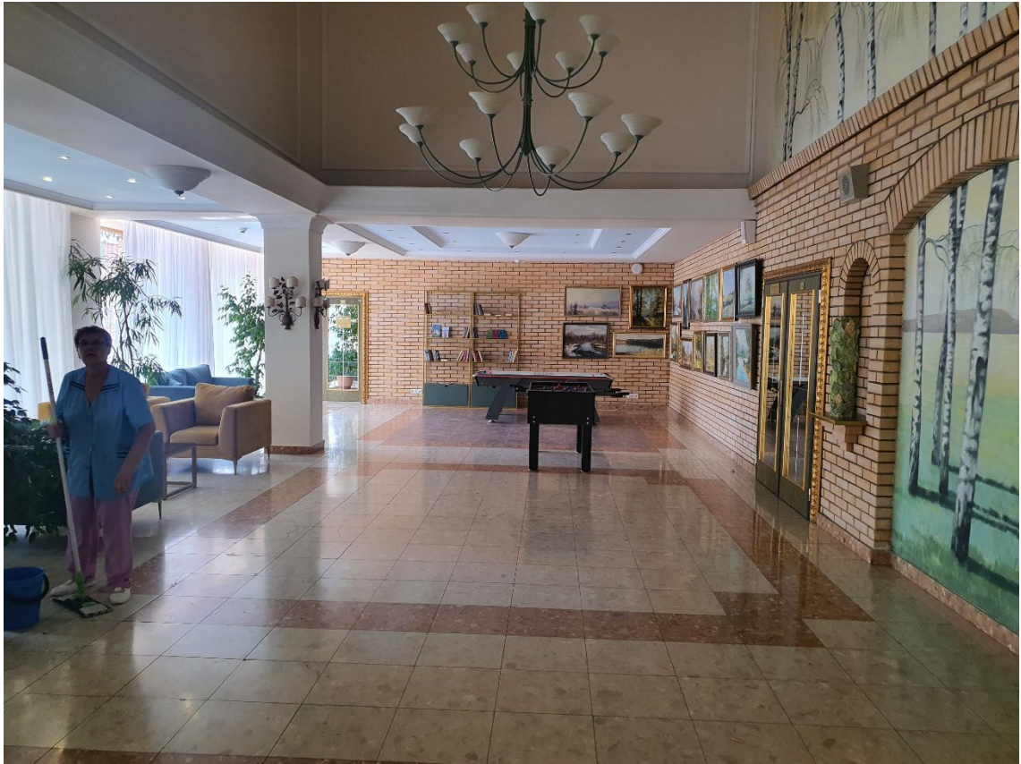
Вид на 2 этаже