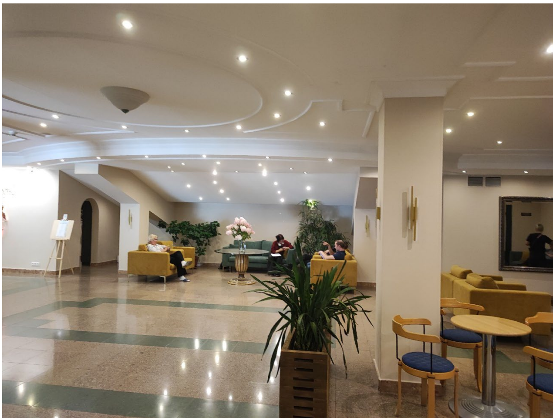
Зона установки ресепшена