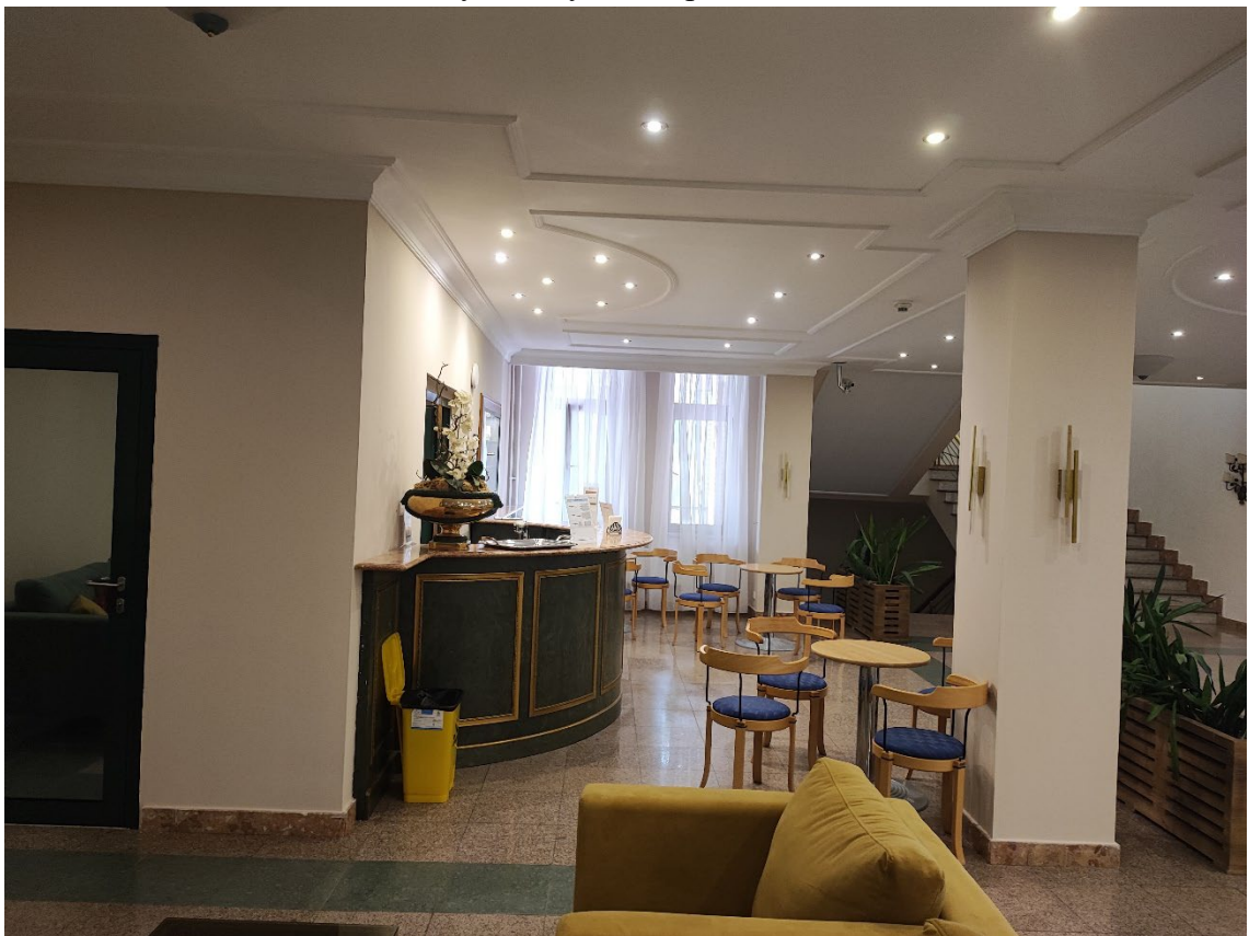
Существующая зона кафе