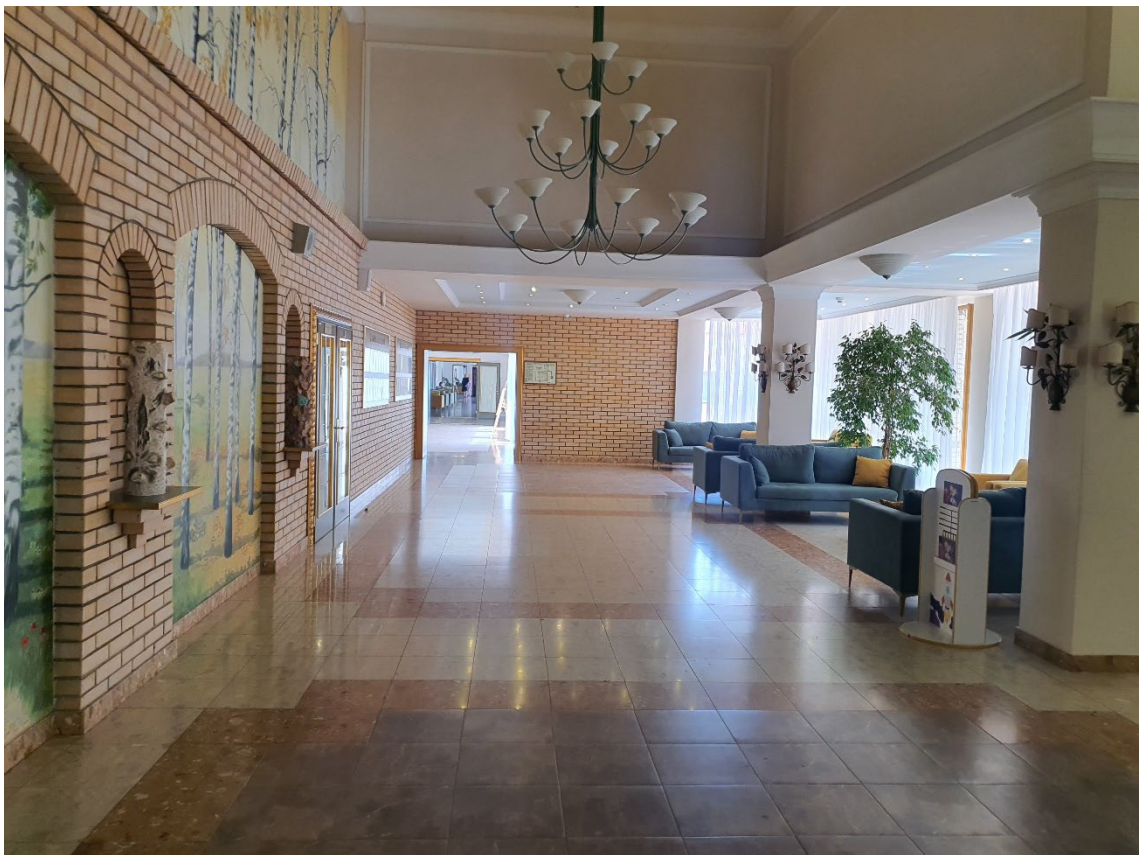
Вид на 2 этаже