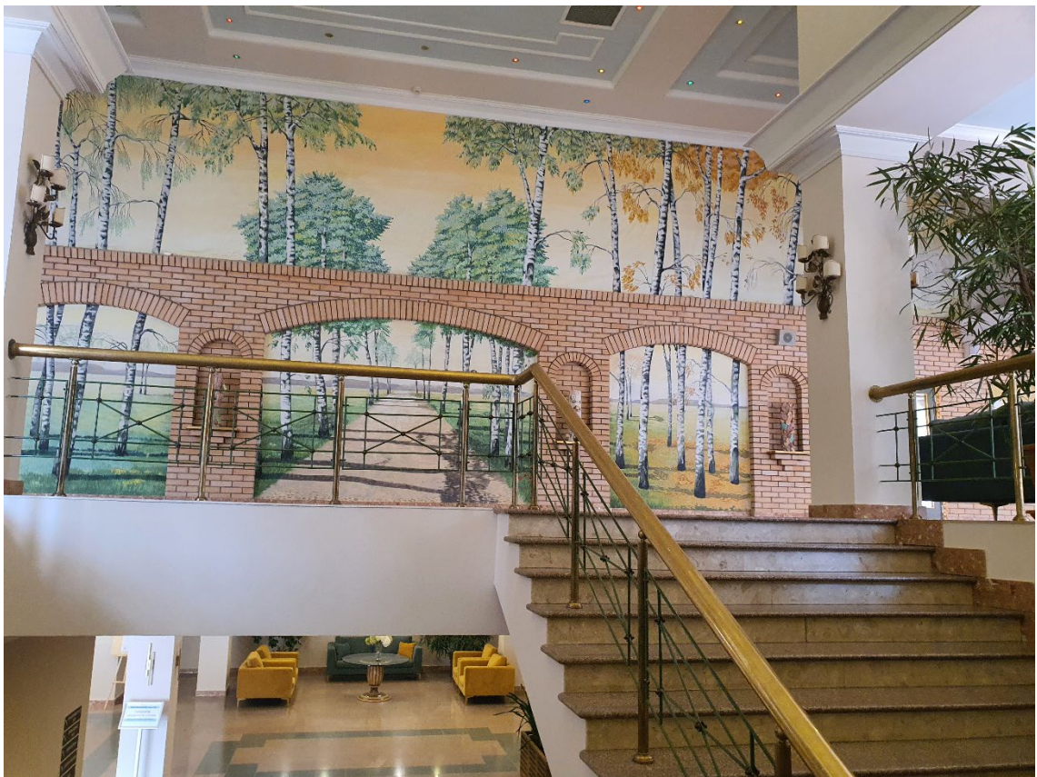
Вход на 2 этаж