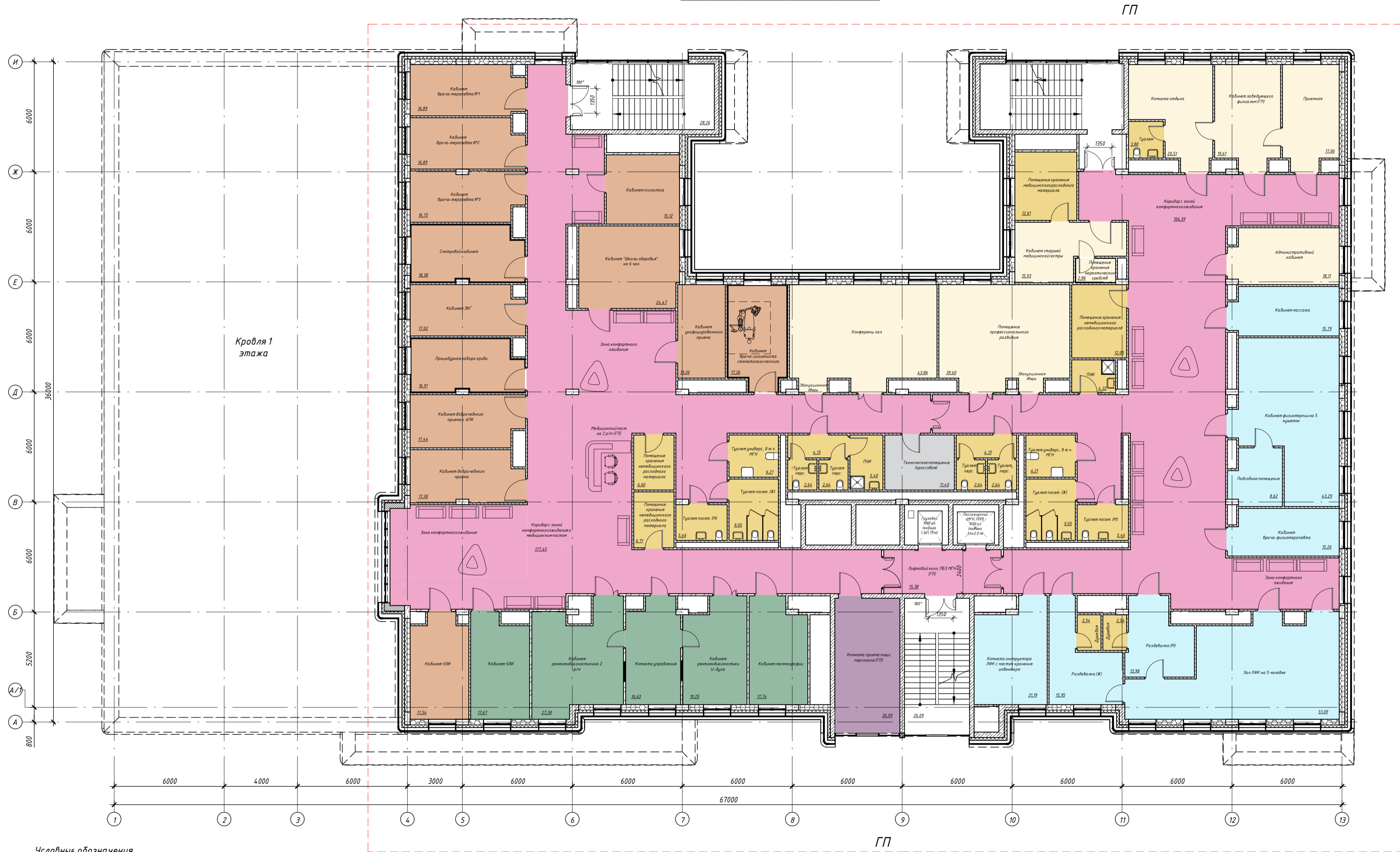
План 4-го этажа на отм.+12.600