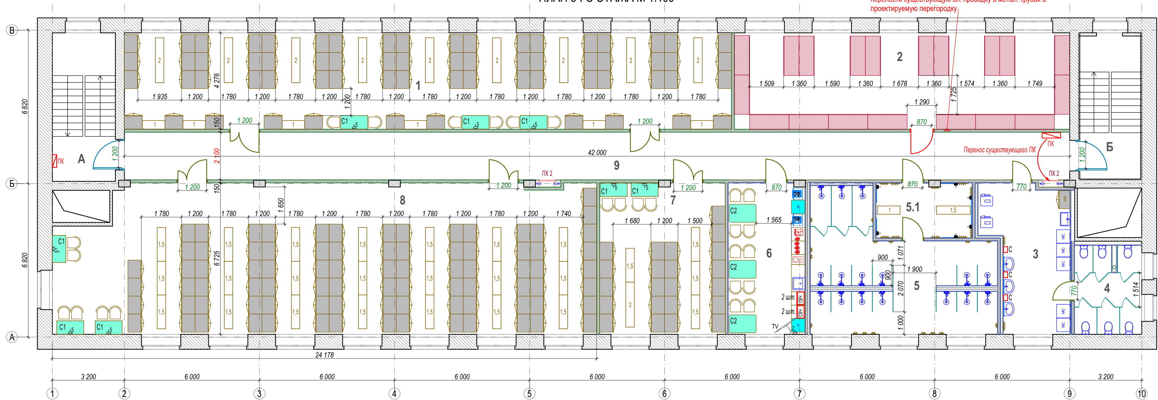
ПЛАН 3-ГО ЭТАЖА М 1:100