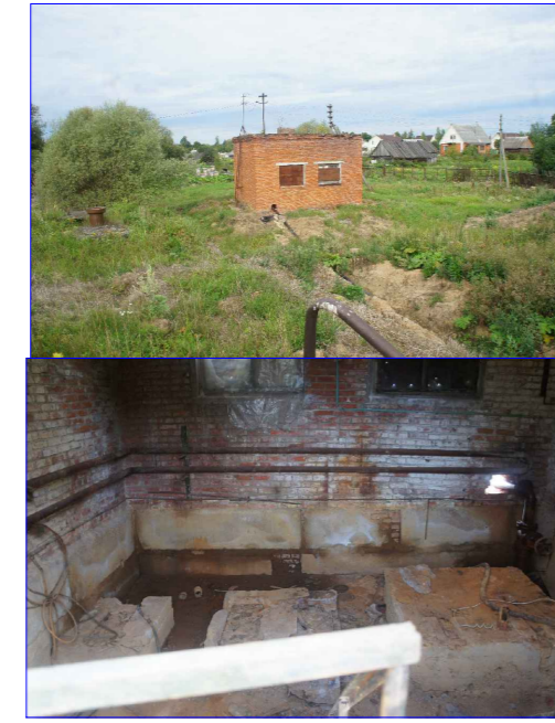
Станция второго подъема. Не рабочая.