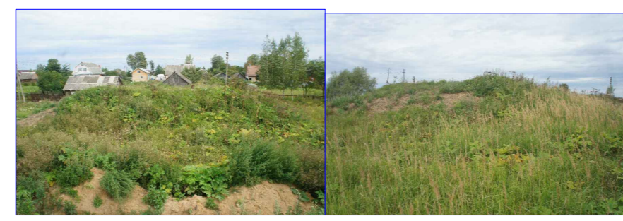
Резервуара 2 шт. Обсыпаны землей ( по исходникам по 250куб)