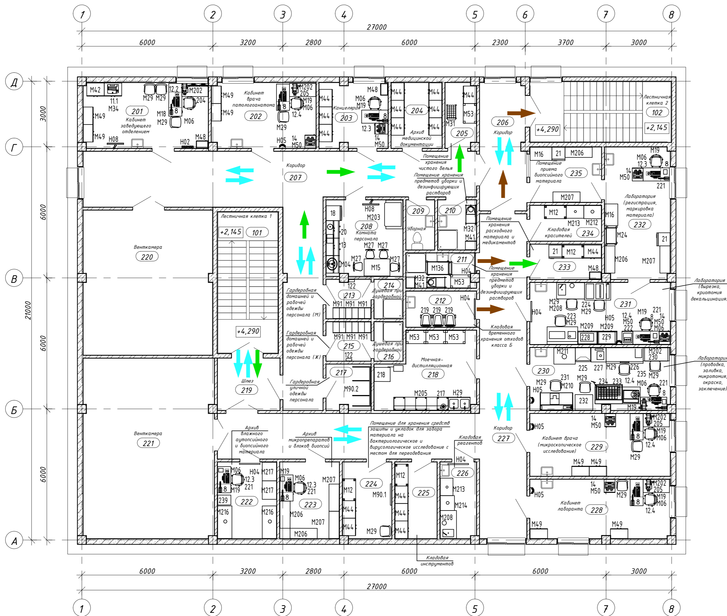
План 2-го этажа