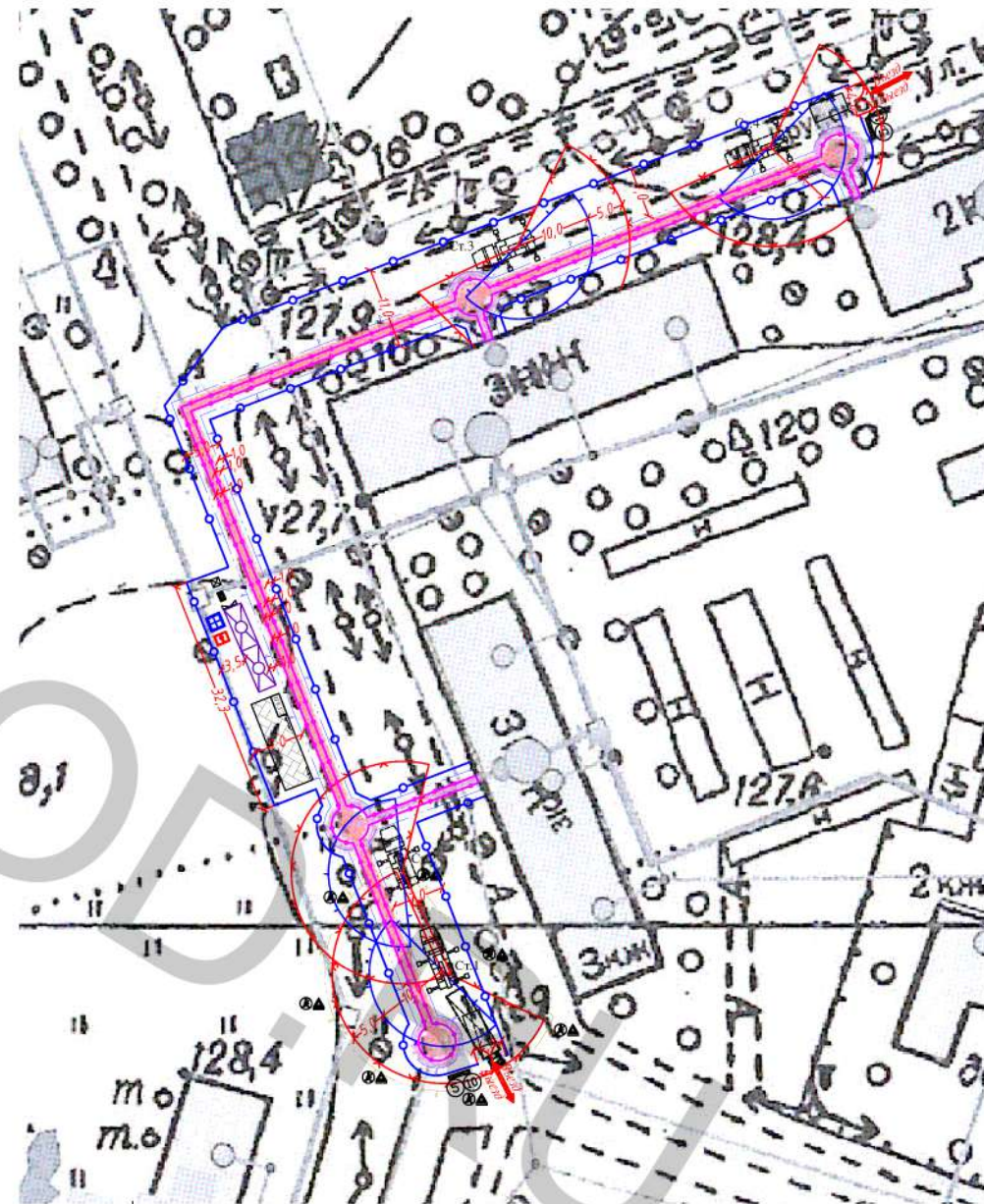
СХЕМА РАЗРАБОТКИ ТРАНШЕИ ЭКСКАВАТОРОМ М1:100

Площадь строительной площадки - 2065 м 2 Протяженность временного ограждения - 441,8 м Протяженность вертикальных откосов - 448 м Протяженность ограждения траншей - 447 м Площадь траншеи - 274 м 2