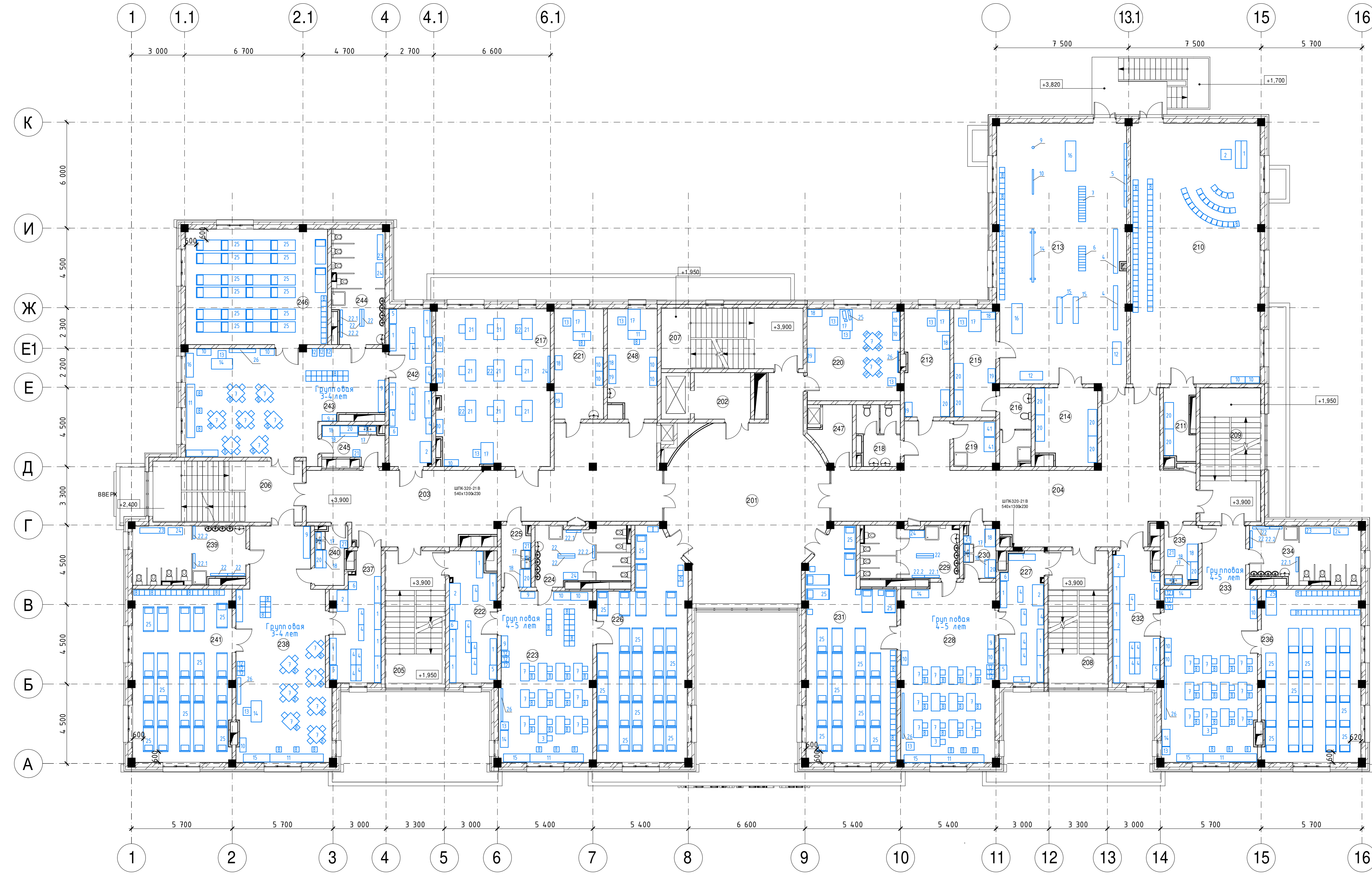
Экспликация помещений этажа на отм. +3.900