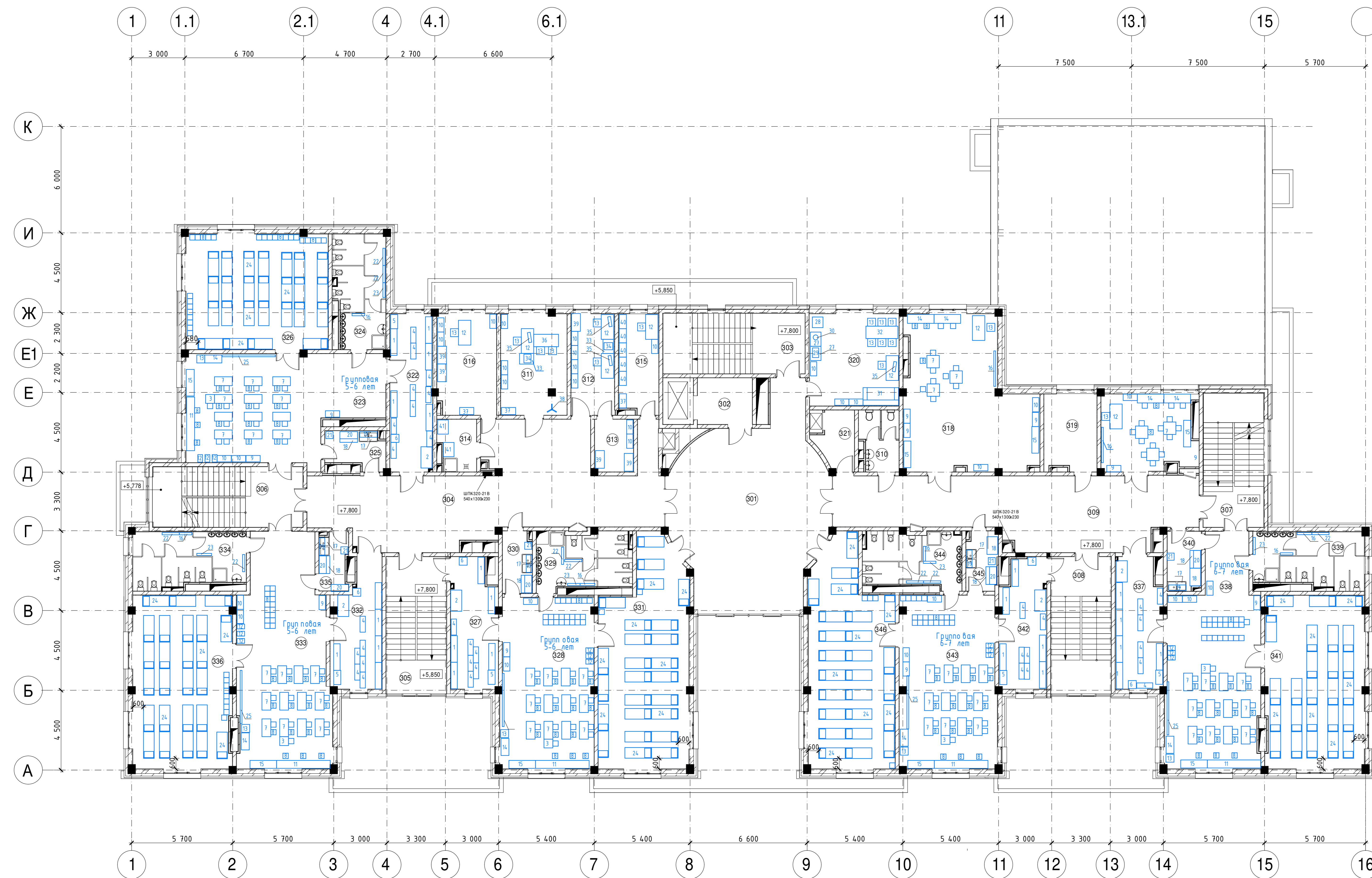
Экспликация помещений этажа на отм. +7.800