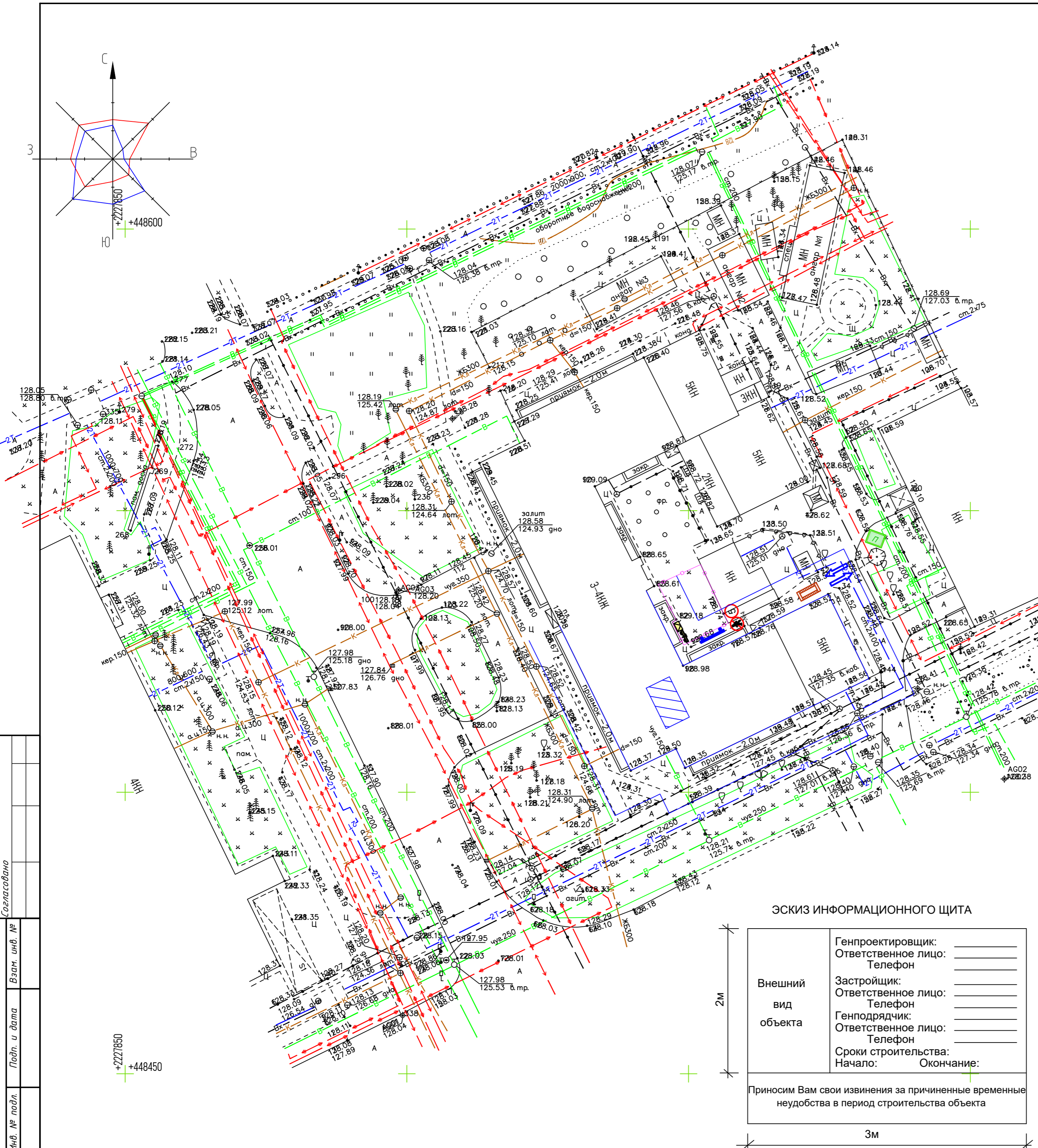
ЭСКИЗ ИНФОРМАЦИОННОГО ЩИТА