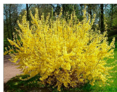
Поз. 4. Форзиция европейская