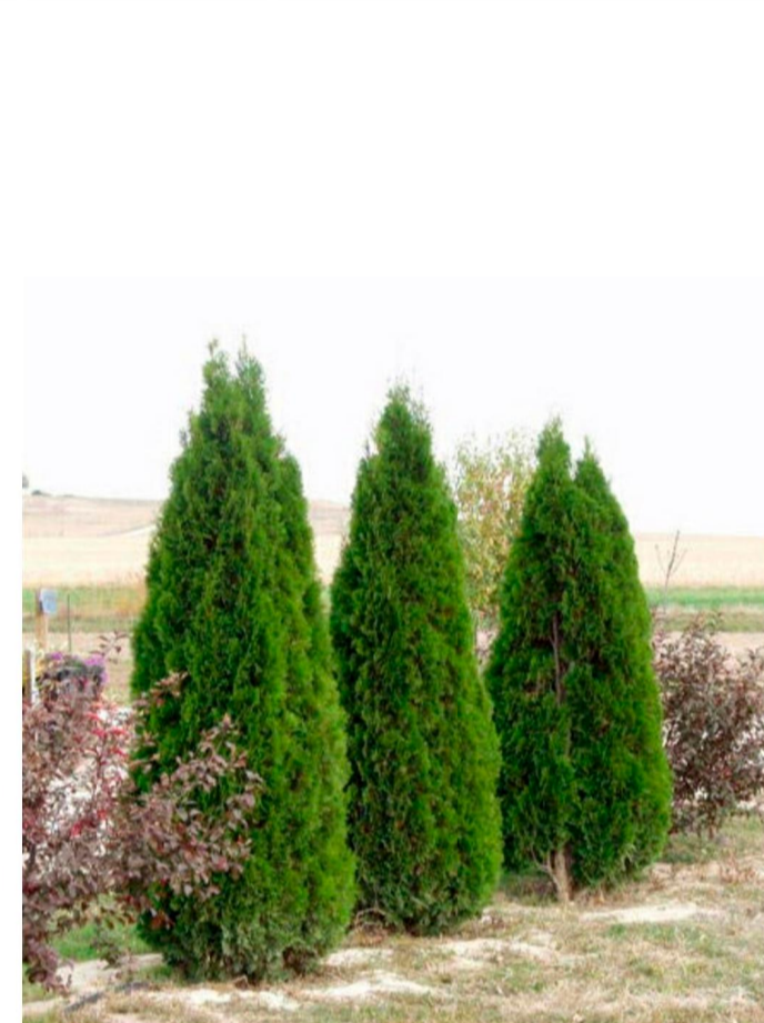
Поз. 3. Туя западная Смарагд