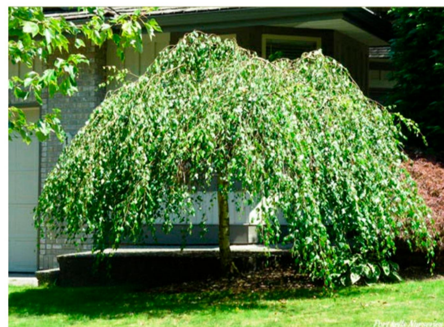
Поз. 2. Берёза повислая Юнга