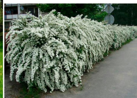
Поз. 5. Спирея Вангутта