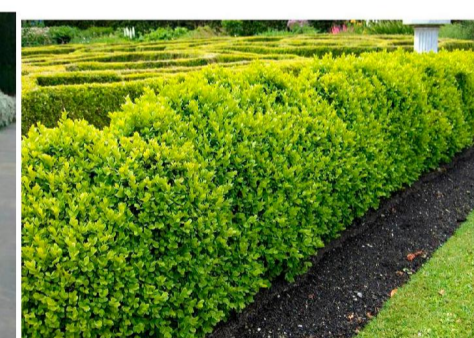
Поз. 6. Самшит вечнозелёный