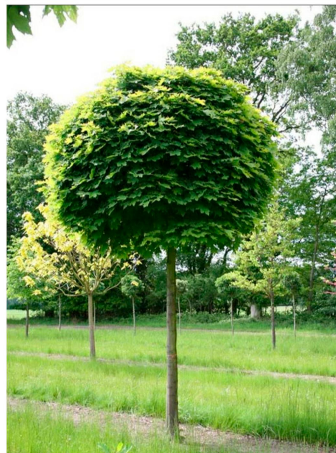
Поз. 1. Клён остролистый Глобоза