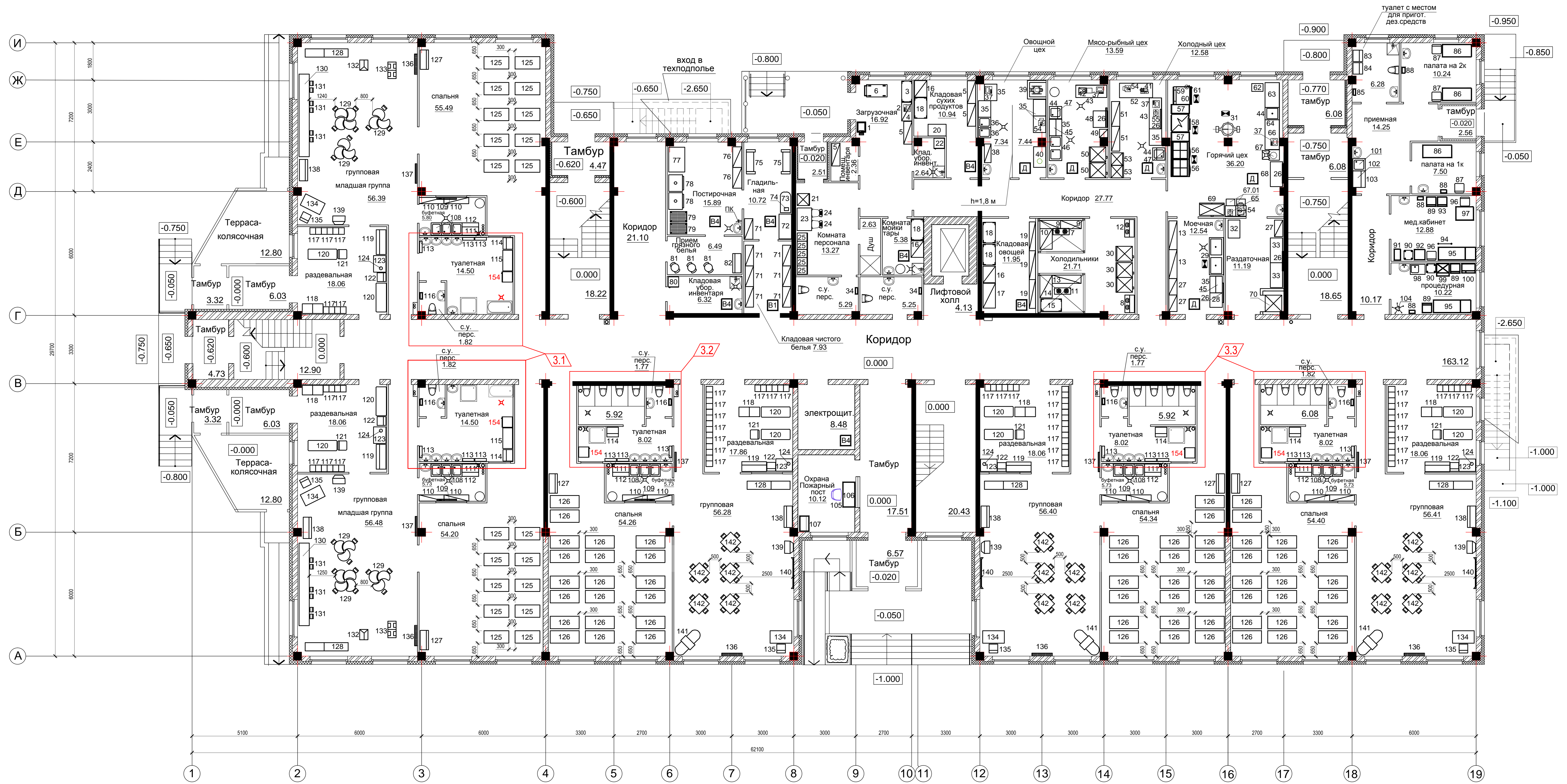
Фрагмент плана помещений техподполья