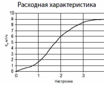
Рисунок 2. Монограмма настройки клапанов Ду=25.

Максимальный перепад давлений на клапане ..... 1,5/2,0 бар. Максимальная скорость перемещаемой среды ..... 4 м/с. Кавитация должна быть исключена.