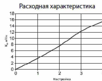
Рисунок 4. Монограмма настройки клапанов Ду=32.

Максимальный перепад давлений на клапане ..... 1,5/2,0 бар. Максимальная скорость перемещаемой среды ..... 4 м/с. Кавитация должна быть исключена.