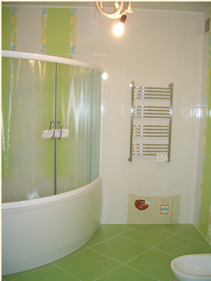
Лестницы "под ключ", сан. узлы "под ключ"