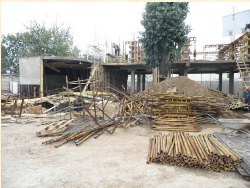
Реконструкция административно-офисного здания с надстройкой и пристройкой. Начало.