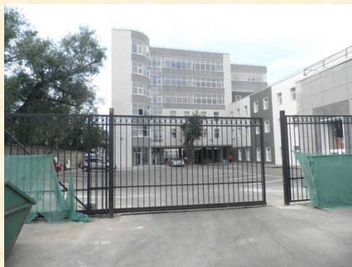
Реконструкция административно-офисного здания с надстройкой и пристройкой. Окончание.

Гарантируем надежное и прозрачное партнерство