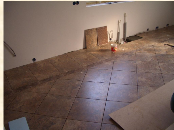
Отделочные работы в частном жилом доме 2012г. пос. Нахабино