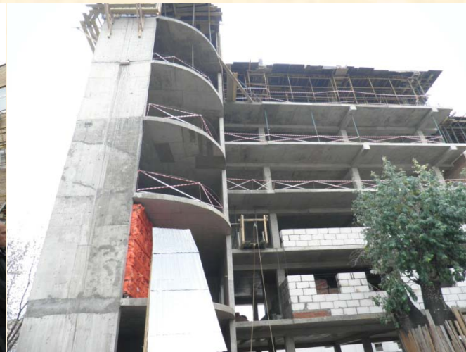
Строительство административно-офисного центра м. Марьино Роцца. 2011-2012гг.