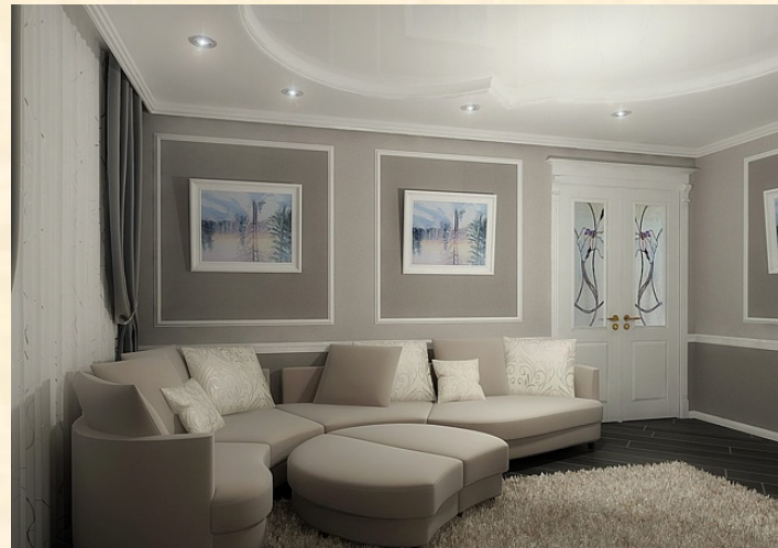
Дизайн-проект квартиры на ул. Спиридоновка