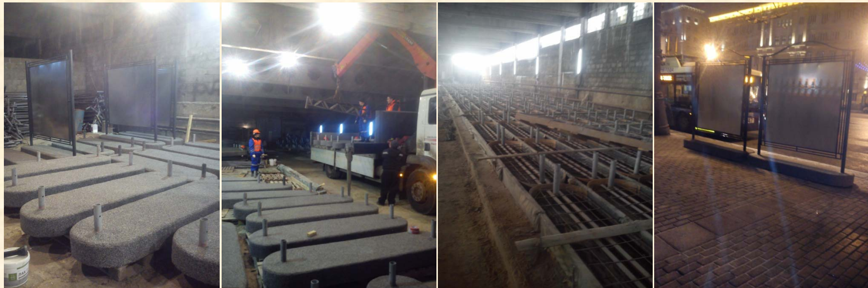
2014г. Изготовление на производственной базе и установка на улицах г. Москвы рекламных стендов 5000шт