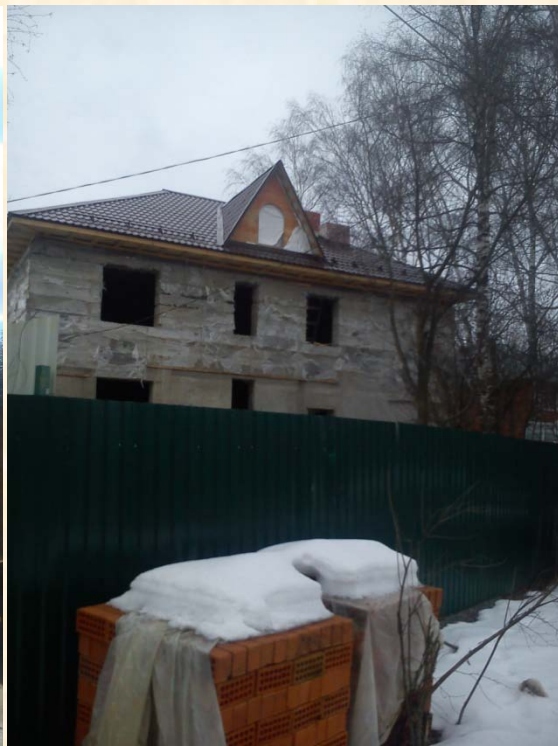
Загородный дом п. Софрино 2012–2013гг.