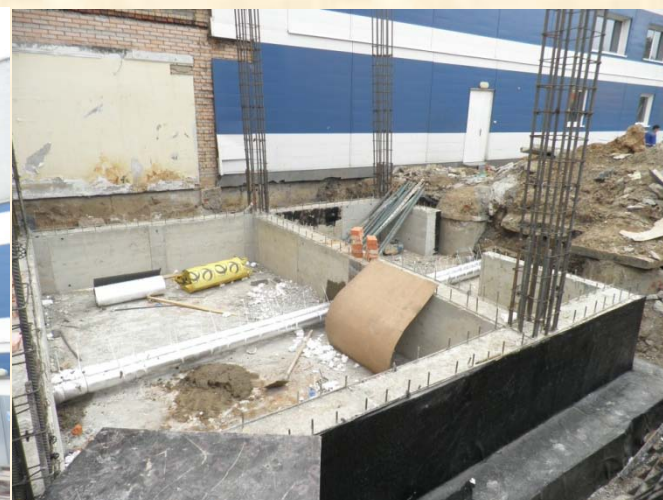
Пристройка к ФОК м. Марьино Роцца. 2012-2013гг.