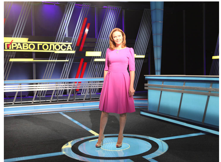
2014г. Строительство и оформление студии ТВЦ программа " ПРАВО ГОЛОСА "