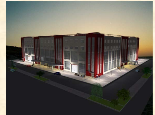
Торговый центр «Садовод». Торгово-офисный центр.

Выполнение всех работ по коммерческому и малоэтажному строительству – от проектирования и работ нулевого цикла до сдачи готового объекта в эксплуатацию. Проектные работы, получение разрешений и согласований, комплекс земляных, инженерных и строительно-монтажных работ, внешних и внутренних отделочных работ, благоустройство.