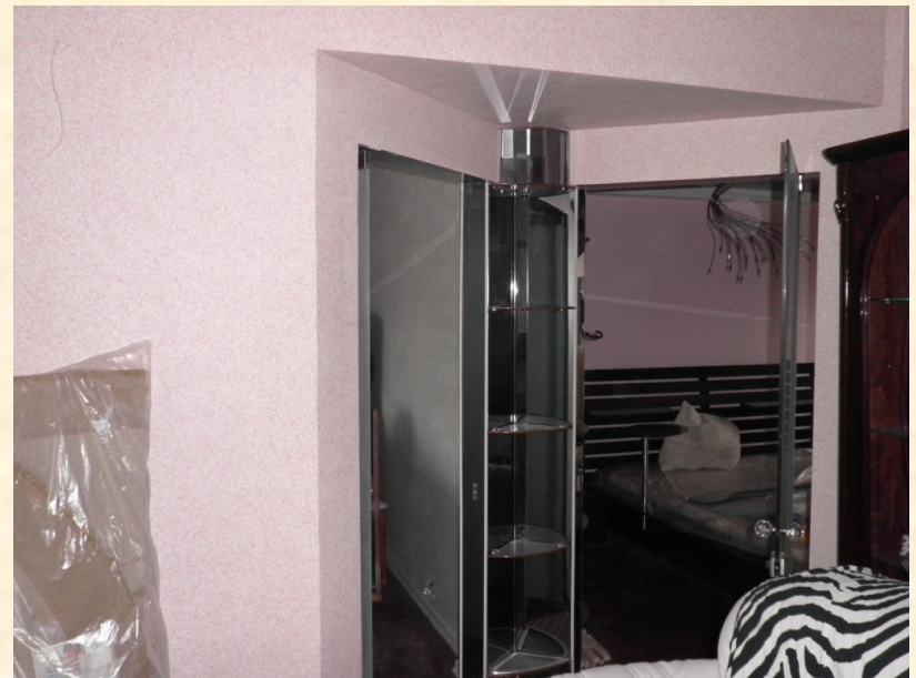
Обычная трешка П44. Глобальная перестройка. Начало Эры