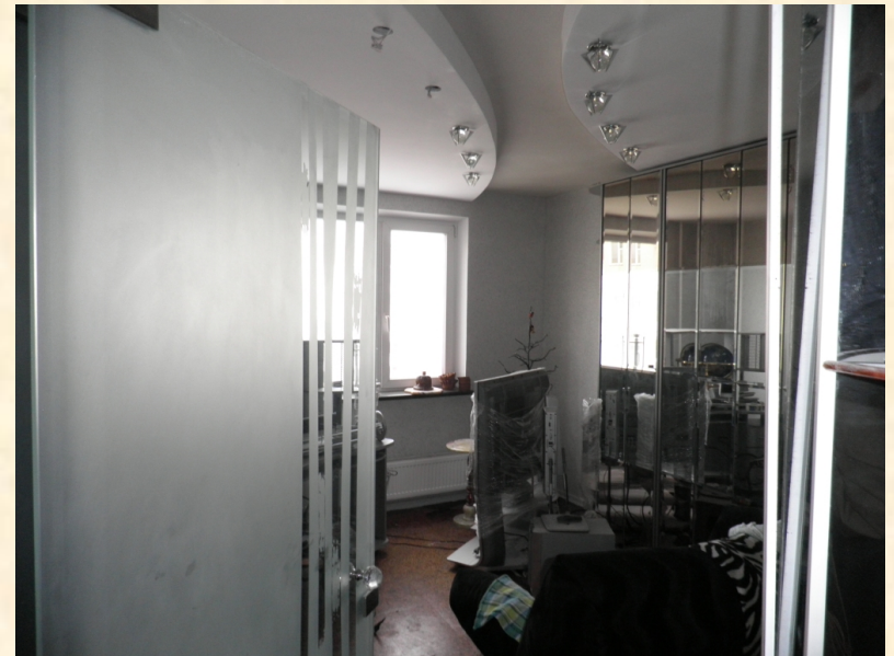
Мозаичные краски на стенах. Пробка на полах.