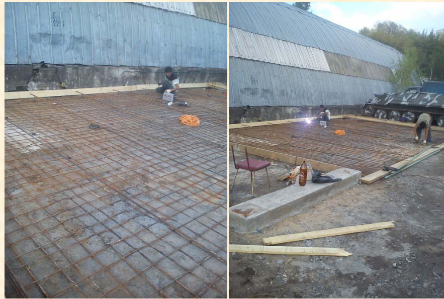
Ангар под хранение спец. техники 2013г. м.Сходненская