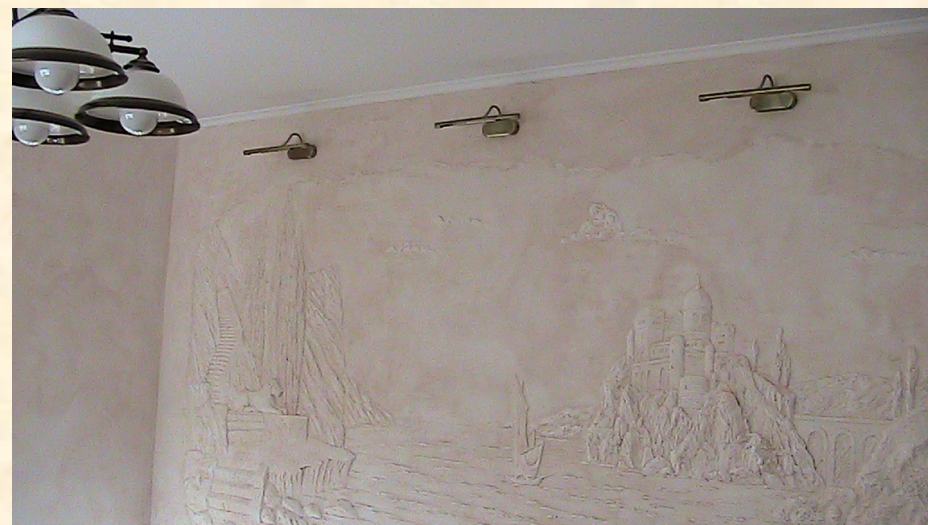
Паркетные и плиточные работы, работа с натуральным камнем, изготовление барельефов и нанесение декоративной штукатурки