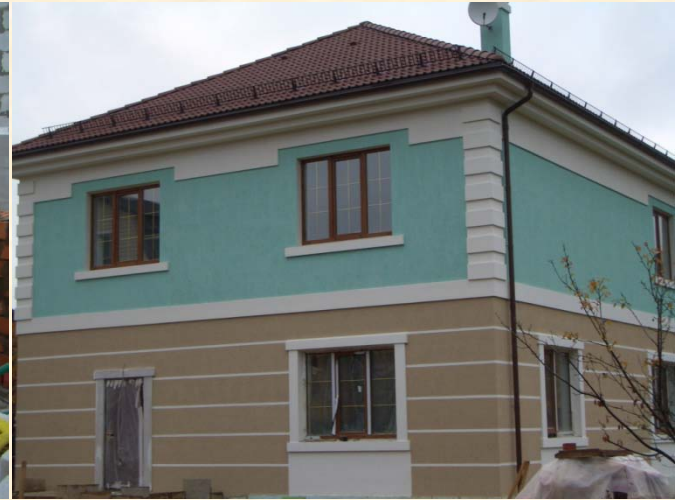
Загородный дом п. Шереметьевский 2012–2013г.