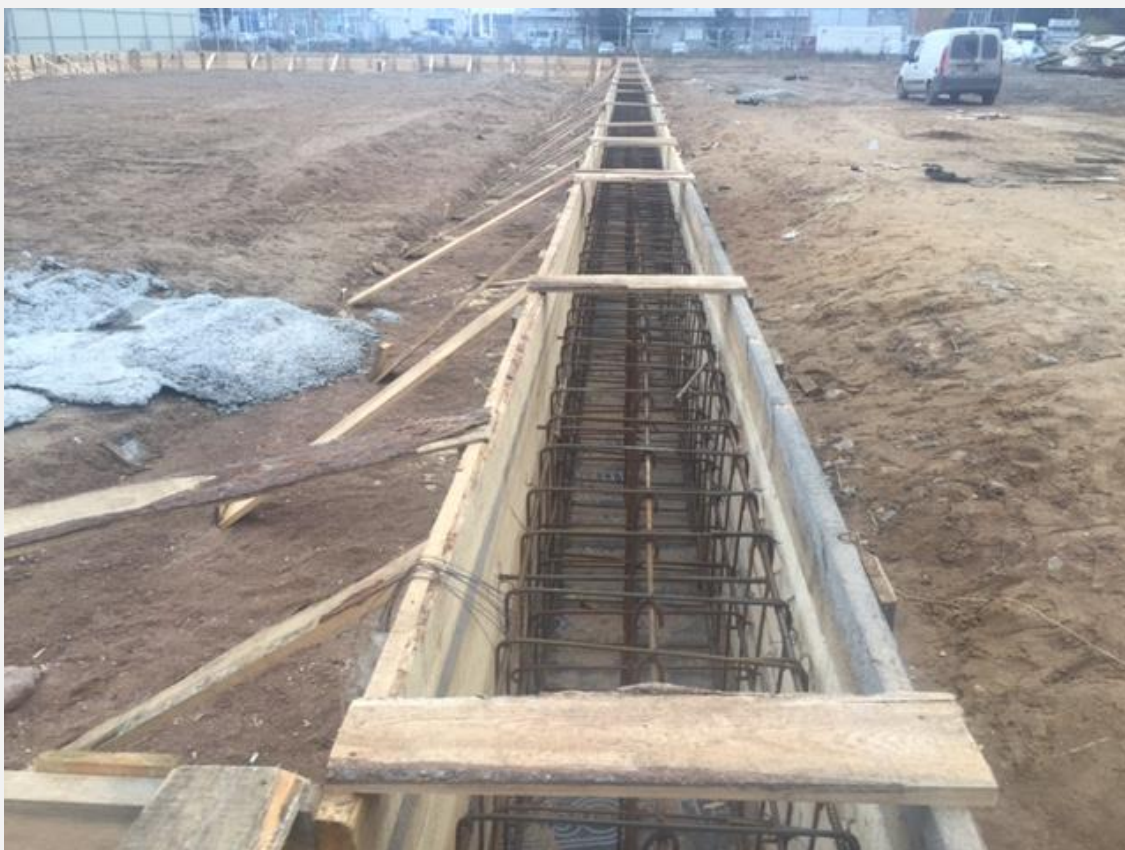
Рисунок 5. Подготовка и заливке фундамента