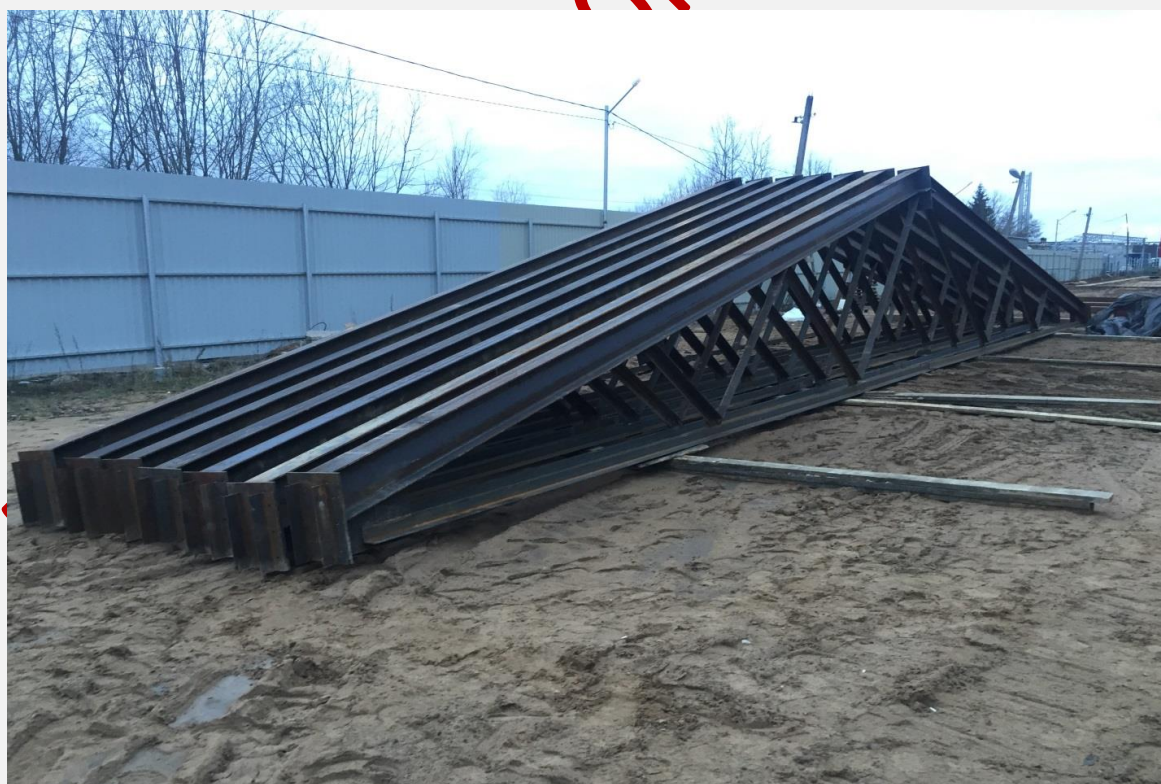
Рисунок 6. Сборка ферм