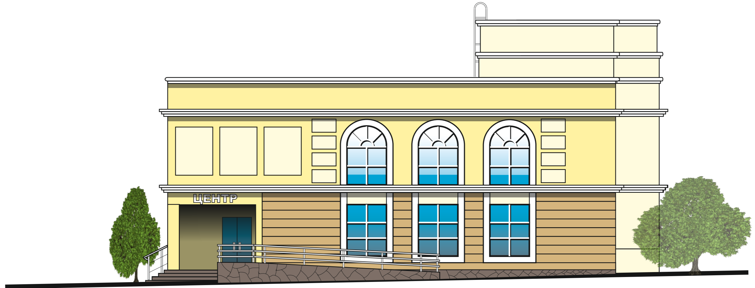
Таблица колера отделки фасадов