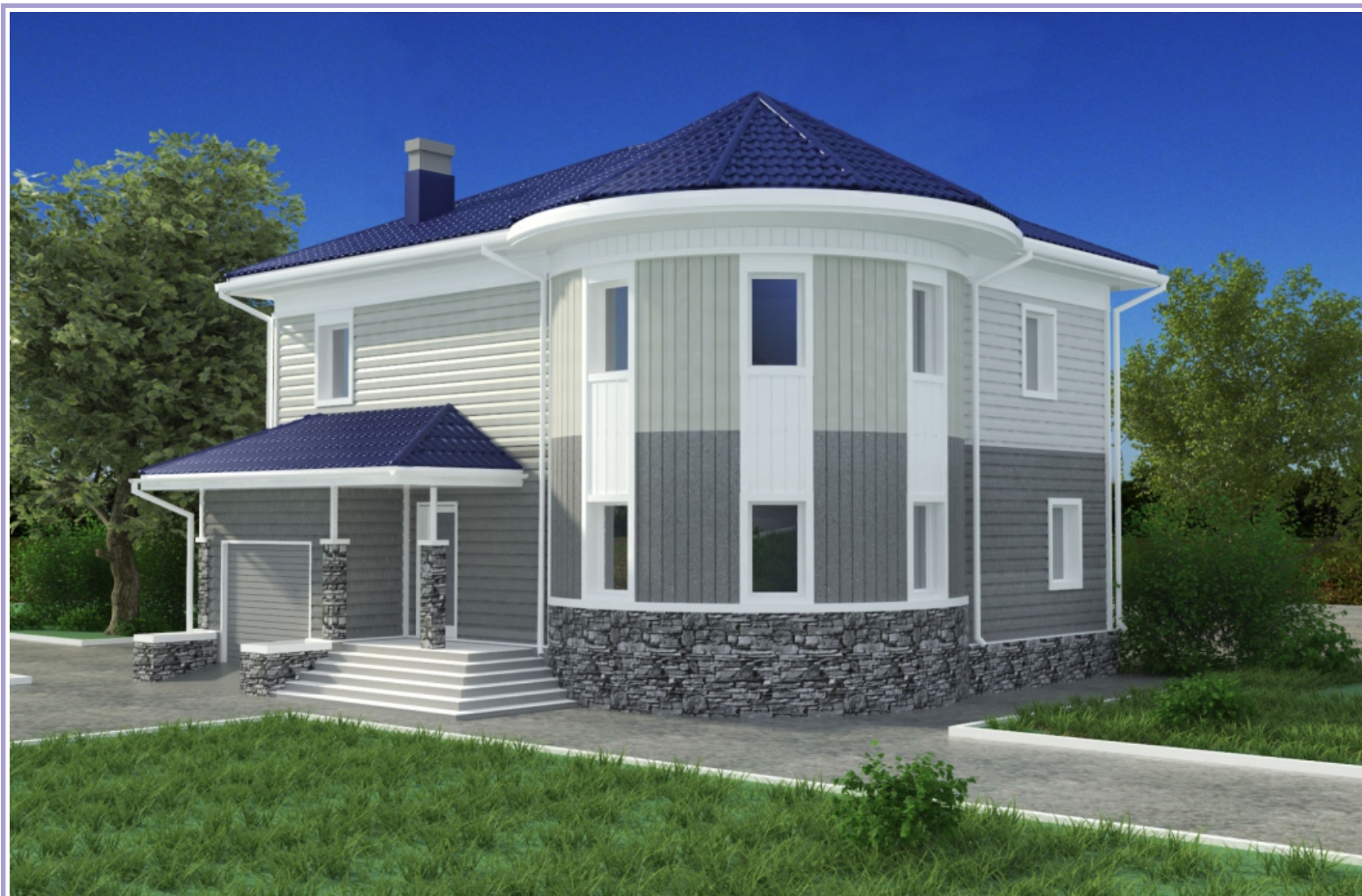
Жилой дом Горном Алтае (запроектирован в стадии ЭП+ визуализация фасадов)