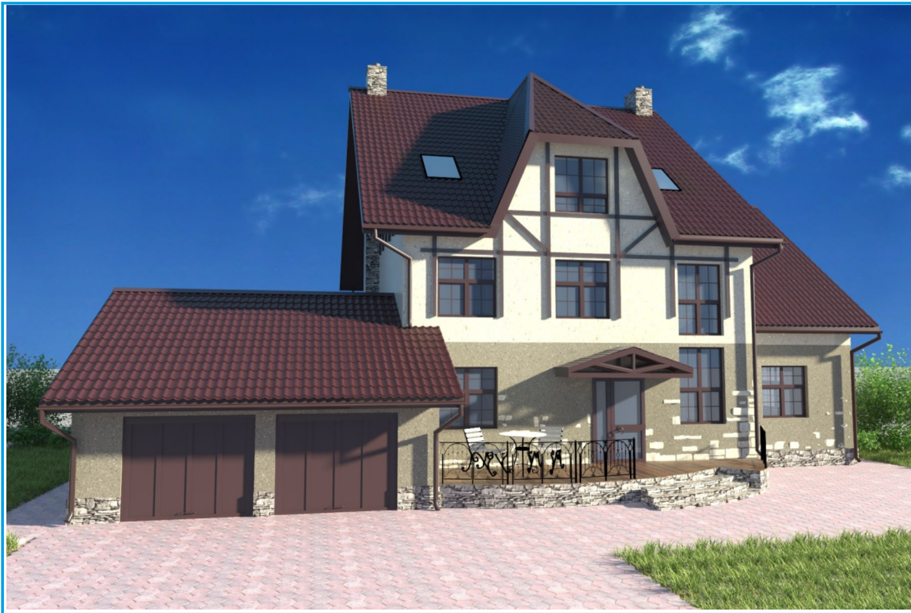
Жилой дом в пригороде г. Барнаула (за основу взят эскиз из каталога, адаптирован под желания заказчика, запроектирован в стадии АР+ визуализация фасадов)