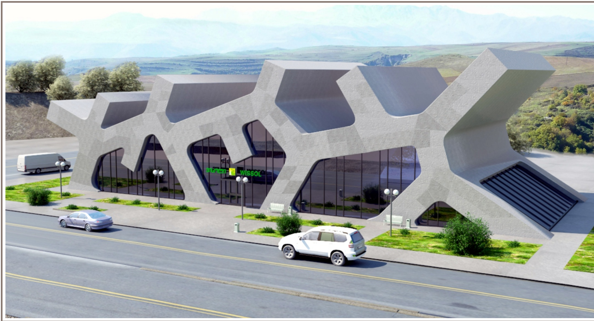
Автостанция в Грузии. (построил по фотографии в свободное время, для интереса)