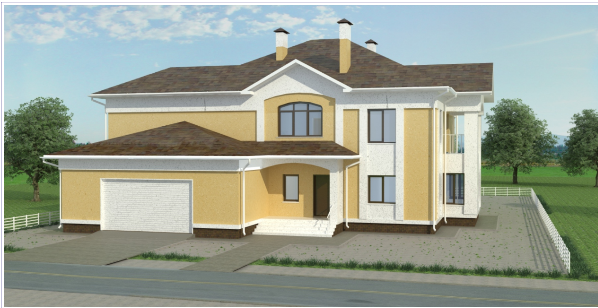
Жилой дом в пригороде г С.Петербурга (запроектирован в стадии ЭП+ визуализация фасадов)