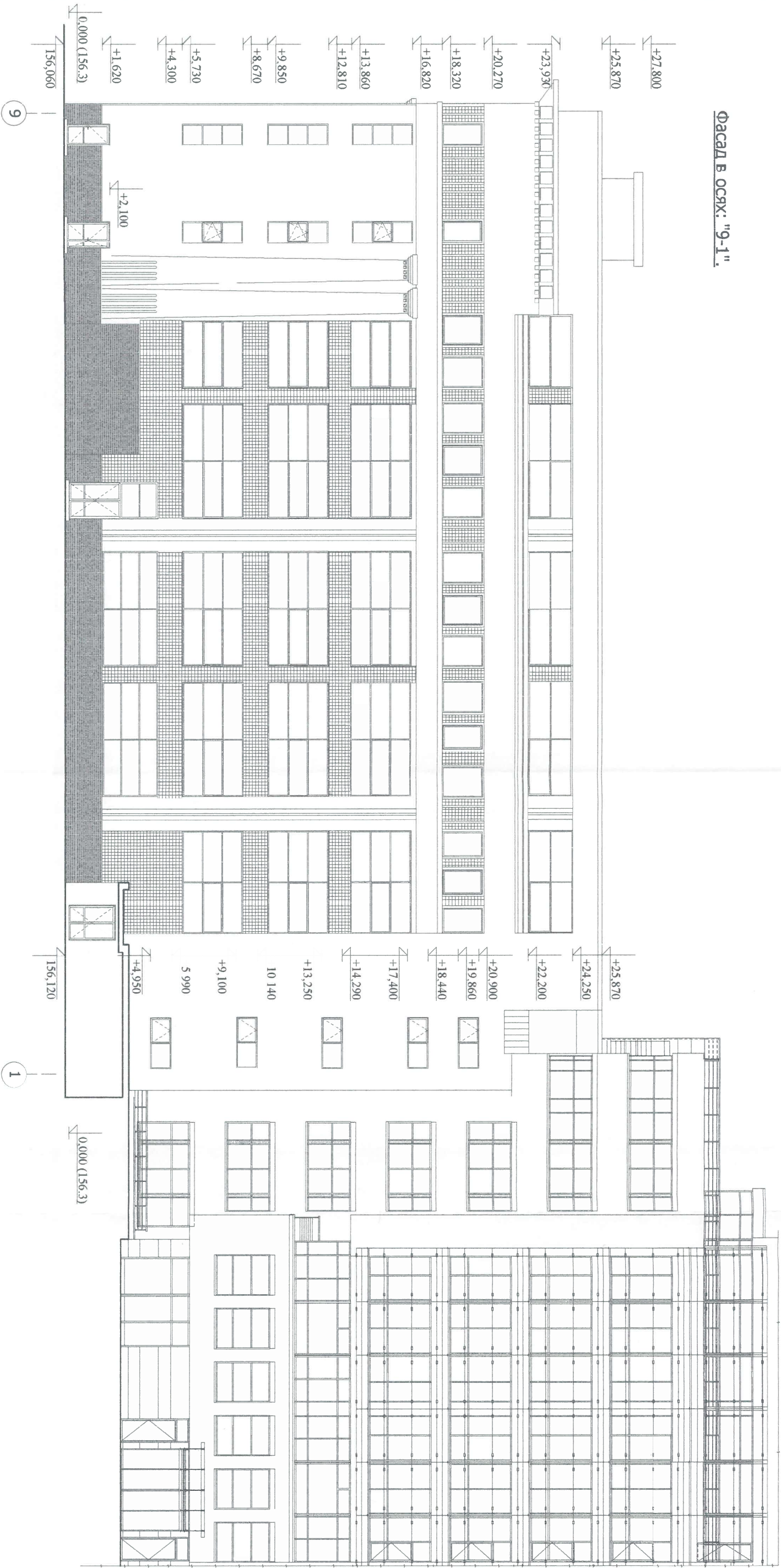
Фасад в осях: "9-1".