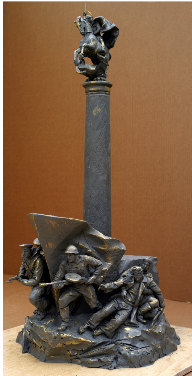
Фото с модели 4