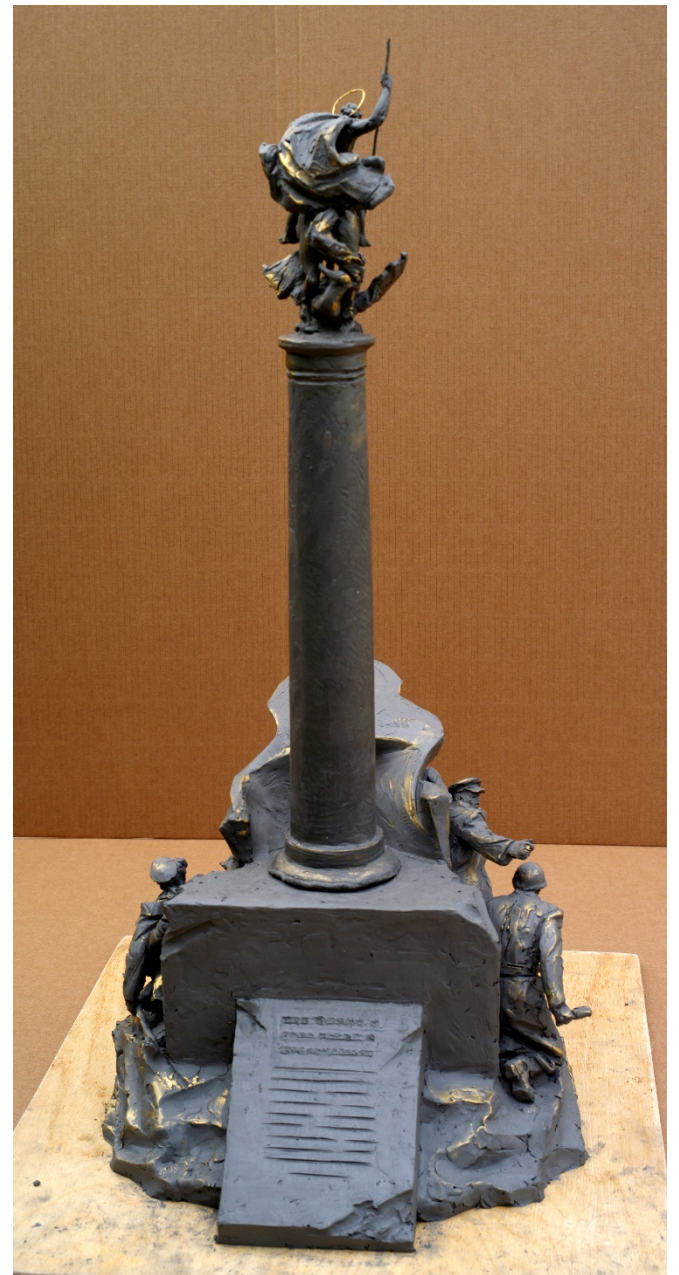
Фото с модели 5