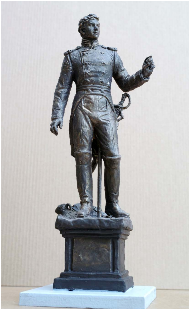
Композиция «Русский чиновник 18 века»