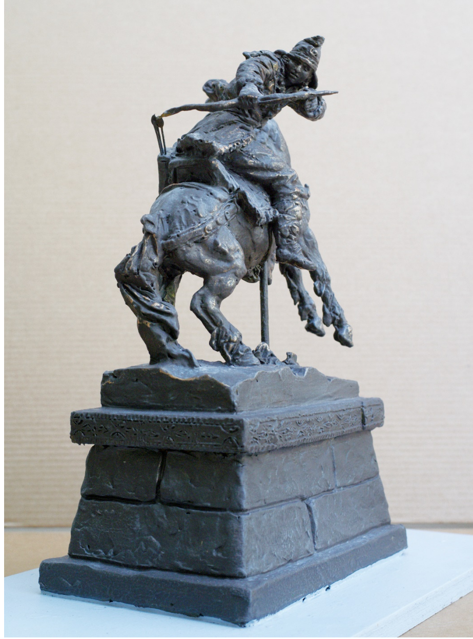
Фото эскиза 10