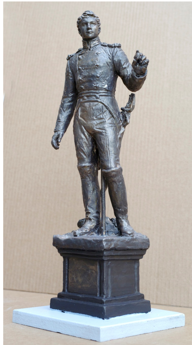
Фото эскиза 14