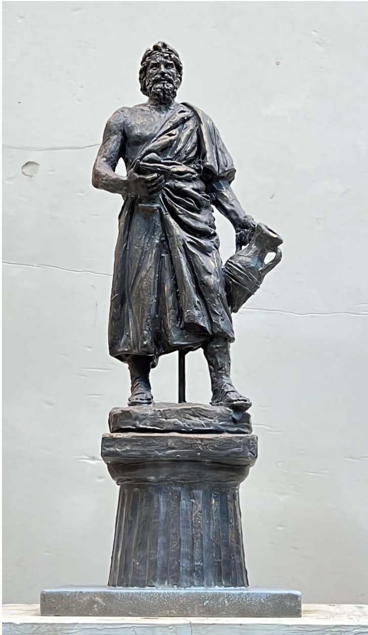
Композиция «Античность - Эллин»