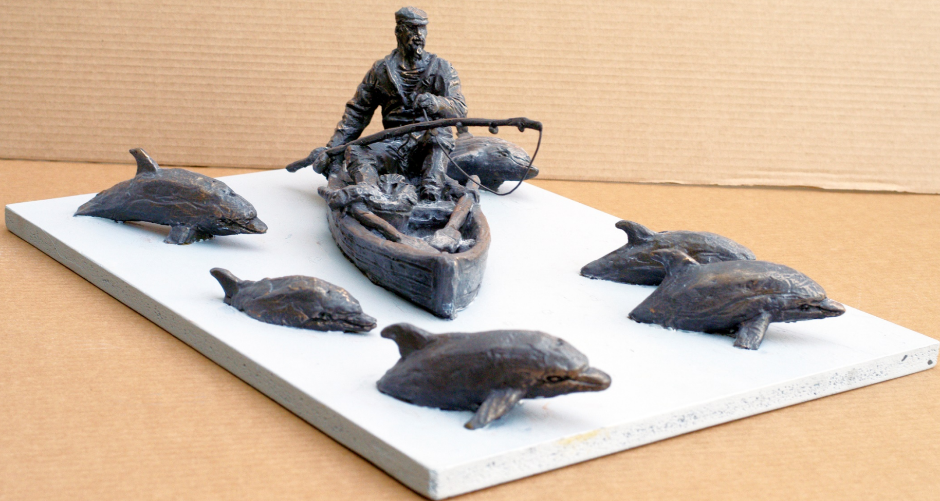
Композиция «Рыбак на лодке и дельфины»