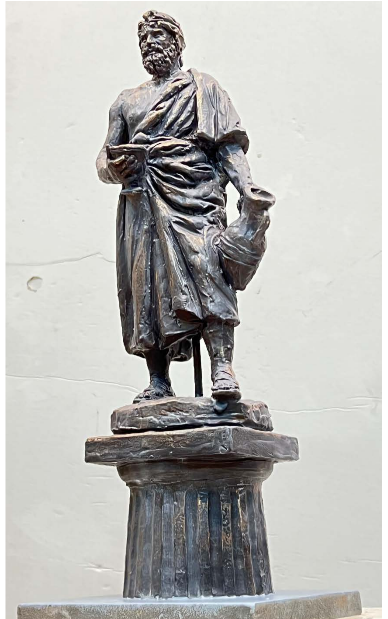
Фото эскиза 9