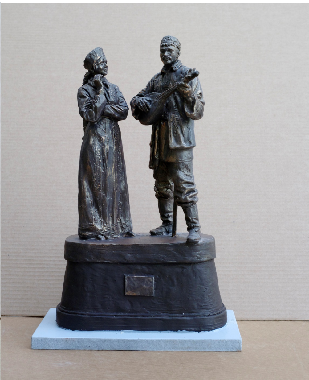
Композиция «Татарин и Русская»