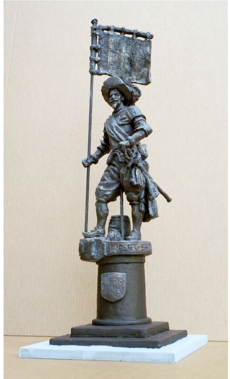
Фото эскиза 11