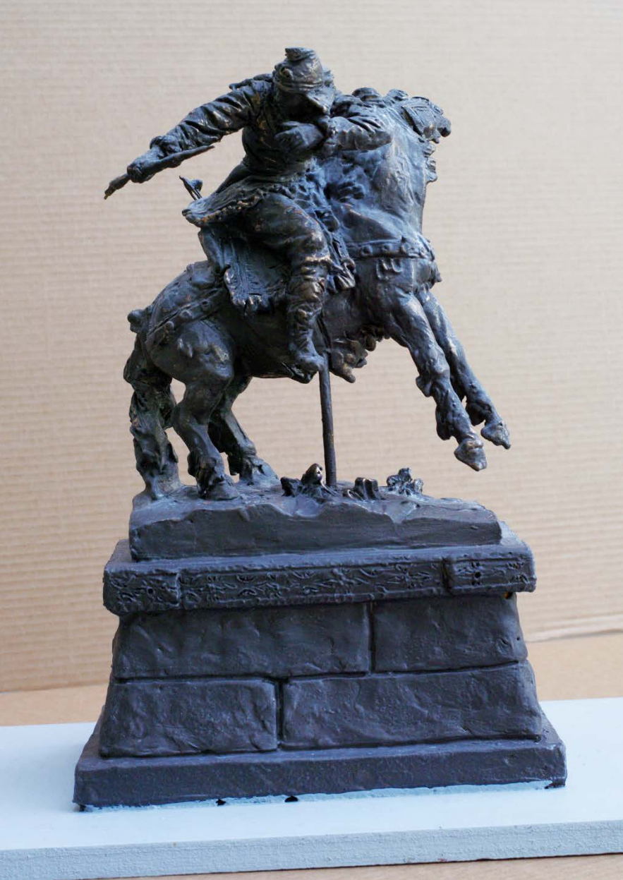
Композиция «Скифянка на коне»